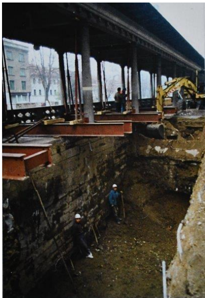
Vpetje stebrov pred betoniranjem 1994