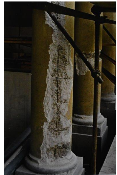
Sanacija stebrov v II. loggie na Rečni strani 1995

Plečnikove tržnice imajo z vidika turizma zelo velik pomen. Ljudje na tržnici lahko Plečnikovo arhitekturo gledajo, vstopijo vanjo in tako začutijo njeno avtentičnost. Začutijo lahko, kako lokalno prebivalstvo živi s svojo tržnico, kaj kupuje, kako se srečuje, kakšni so lokalni in regionalni izdelki. Povečan obisk turistov in življenjska doba materialov pa zahtevata nenehen nadzor nad fizično substanco objektov.