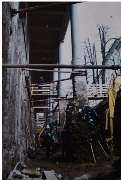
Utrdite zemljine pod stebri 1994