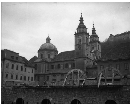
Gradnja Plečnikovih tržnic med 1940 in 1944