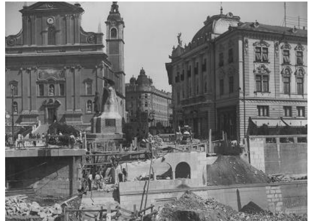
Regulacija Gallusovega nabrežja, 1931, Urejanje nabrežja pred Prešernovim trgom, 1931

Ob nepozidani površini nekdanjega liceja (danes osrednji živilski trg na Vodnikovem trgu) in gimnazije je po letu 1813 za gimnazijskim poslopjem ob Ljubljani nastal Šolski drevored. To je bil drevored kostanjev, med katerimi so bile postavljene mesarske lope in stojnice.